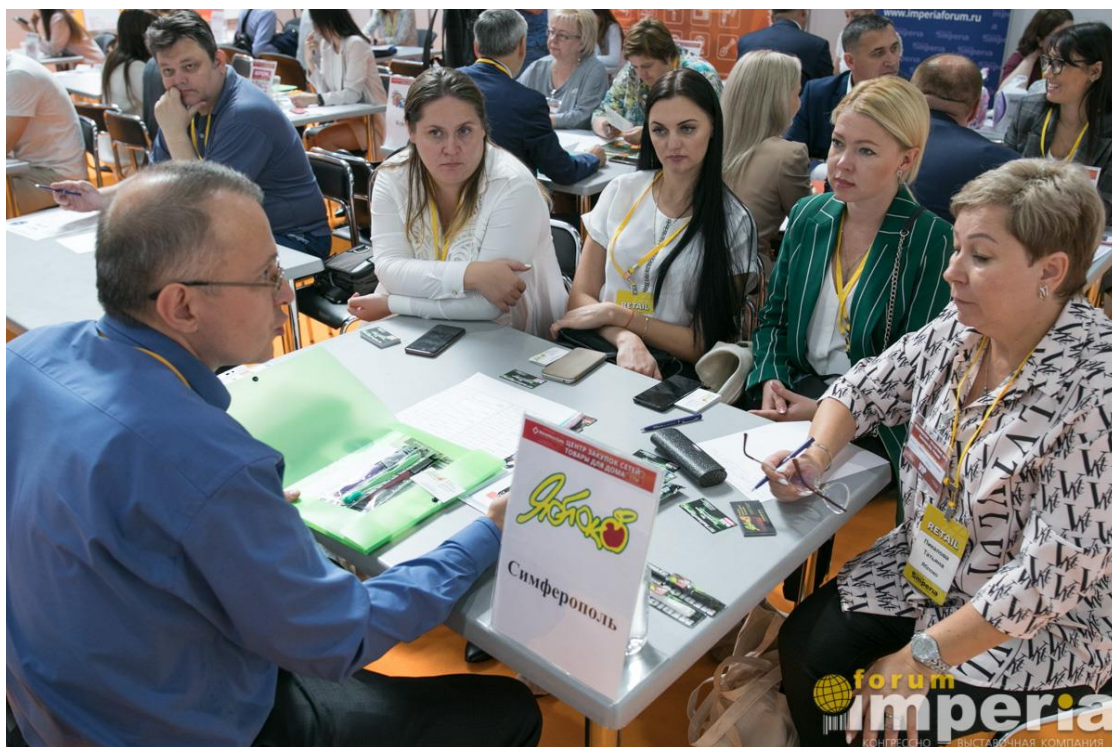
Переговоры с закупщиками розничной сети Яблоко