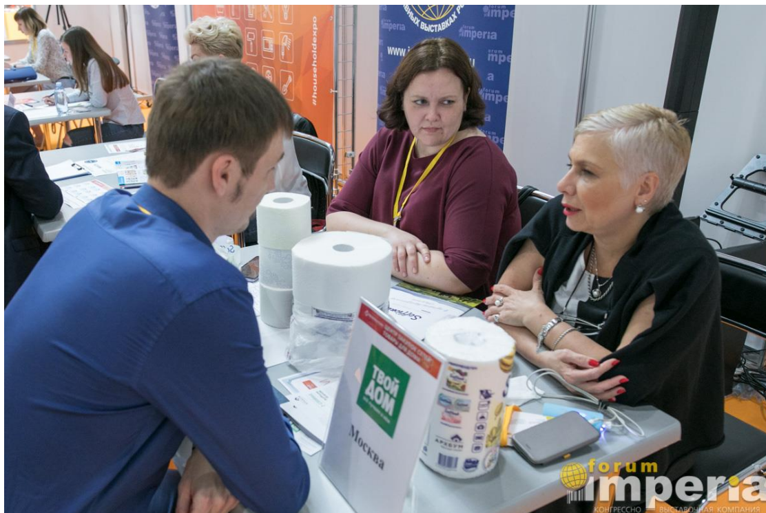
Переговоры с закупщиками розничной сети Твой Дом