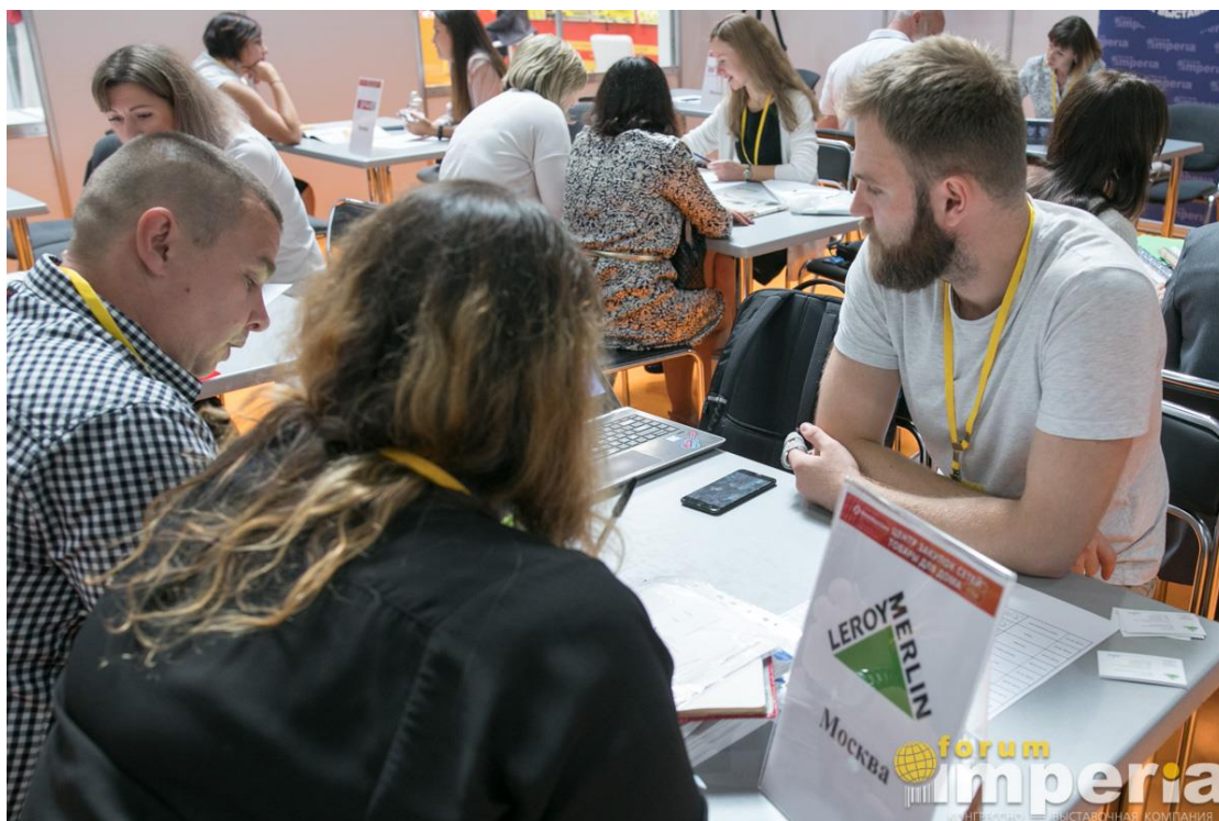
Переговоры с закупщиком розничной сети Leroy Merlin