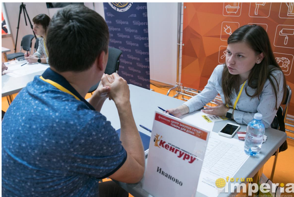
Переговоры с закупщиком розничной сети Кенгуру