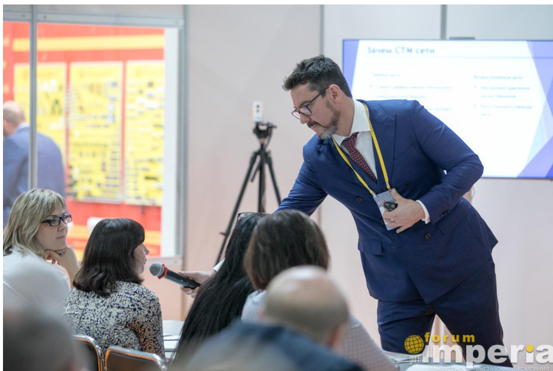
Вопросы из зала