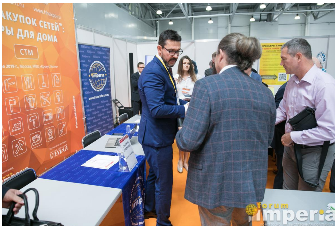
Неформальное общение и обмен визитками спикера и делегатов Семинара