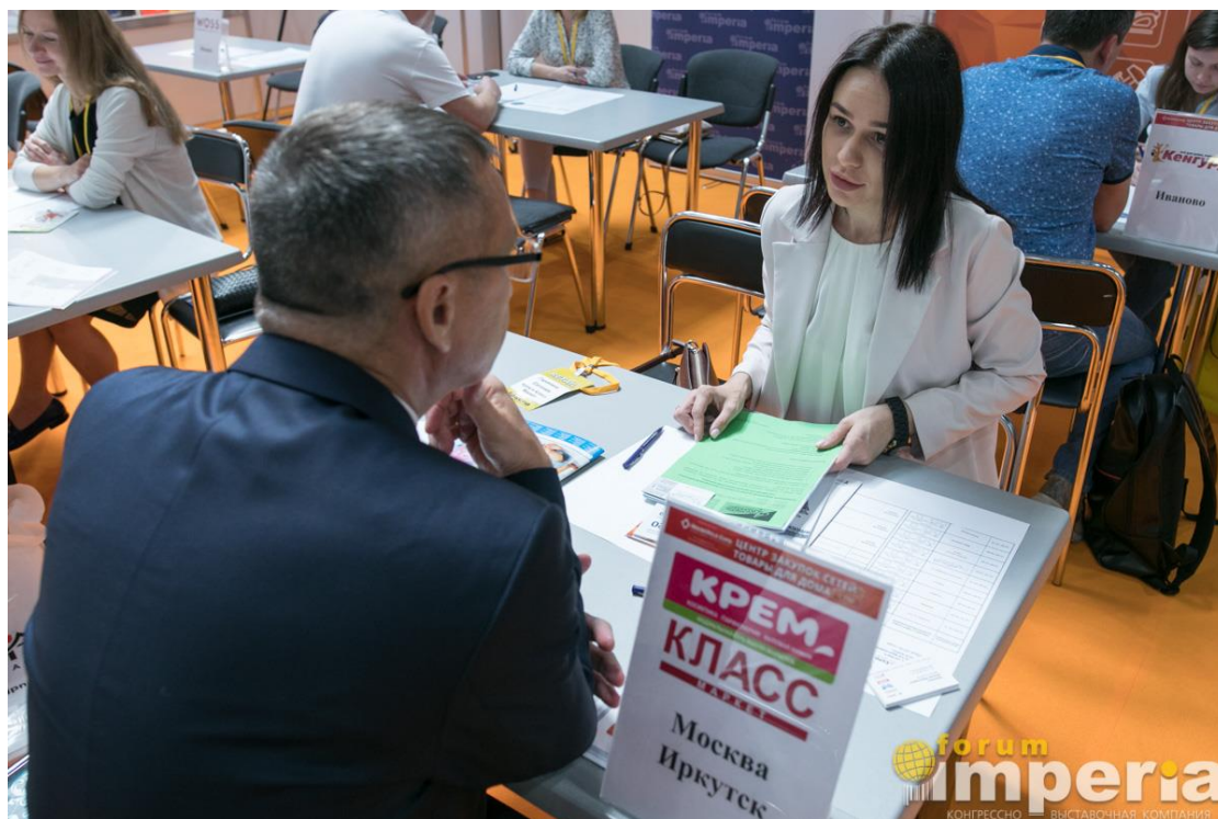
Переговоры с закупщиком розничных сетей Класс-Маркет и Крем