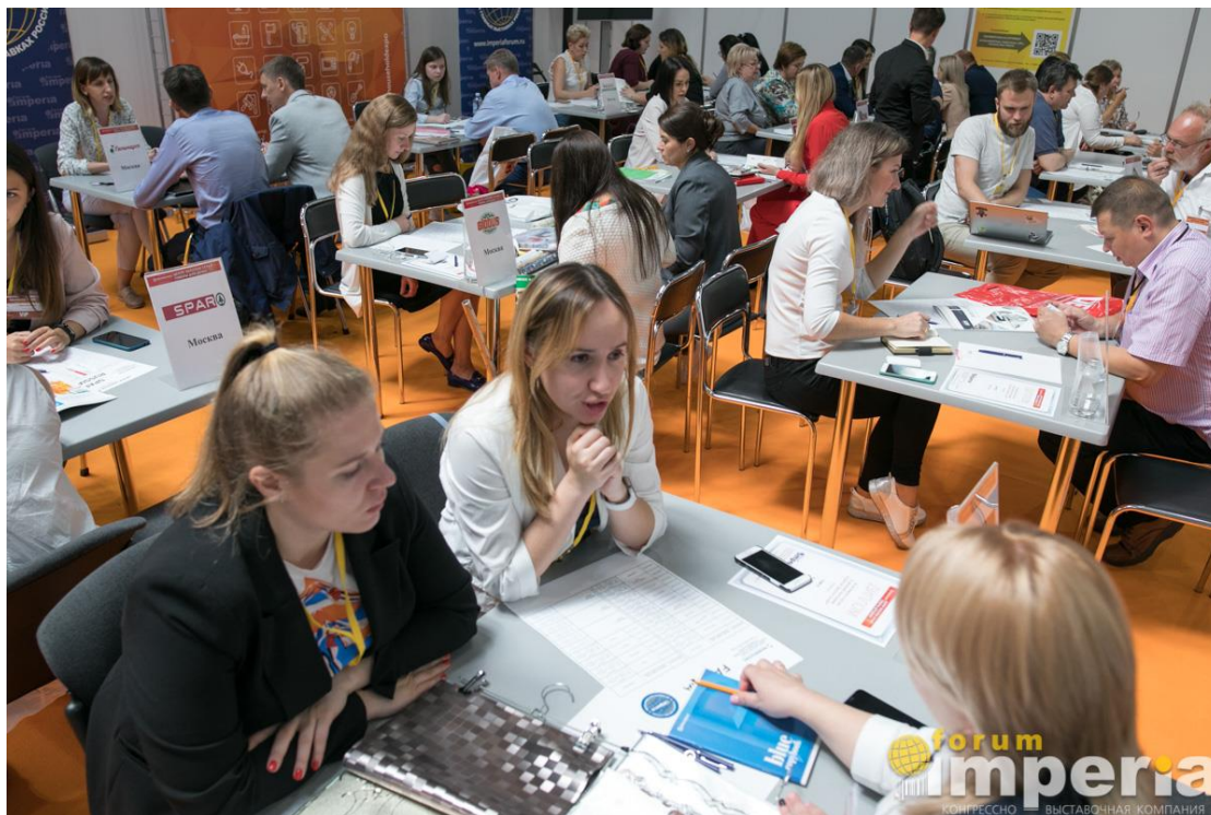
Общий вид Центра Закупок Сетей (15 розничных сетей)