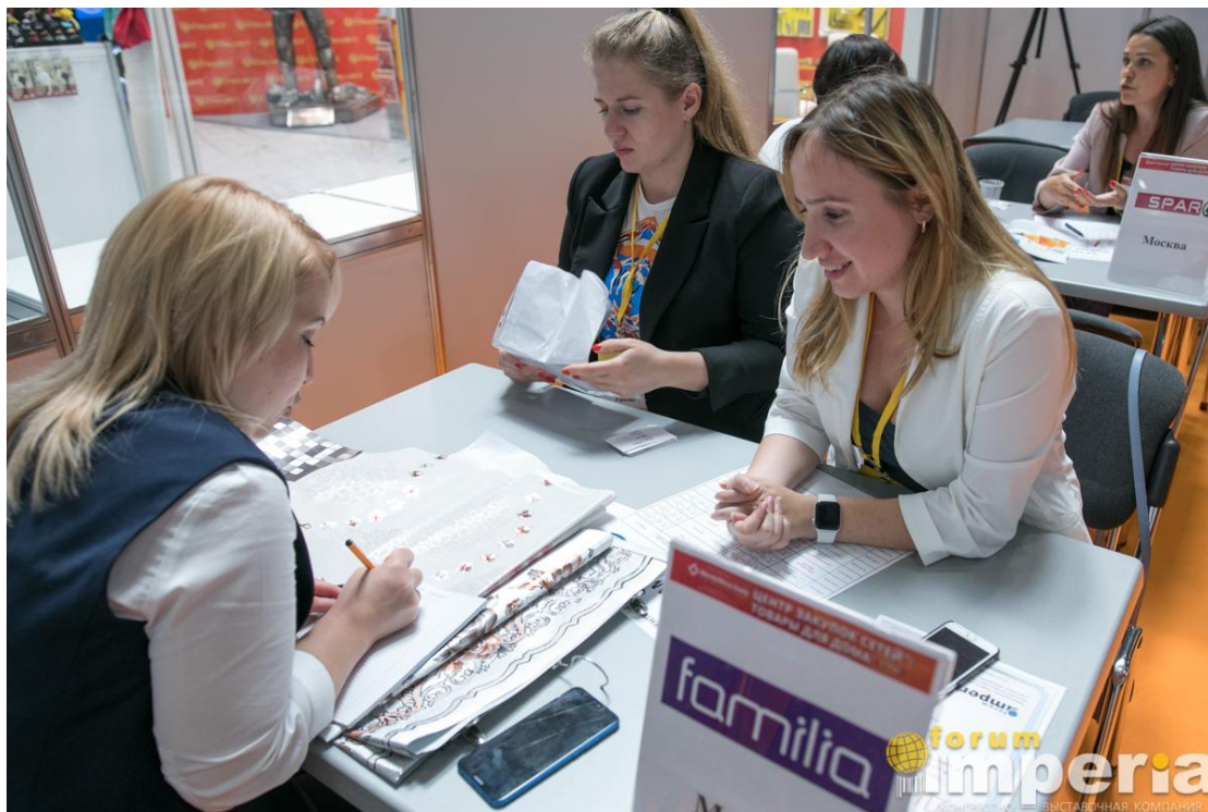
Переговоры с закупщиками розничной сети Familia