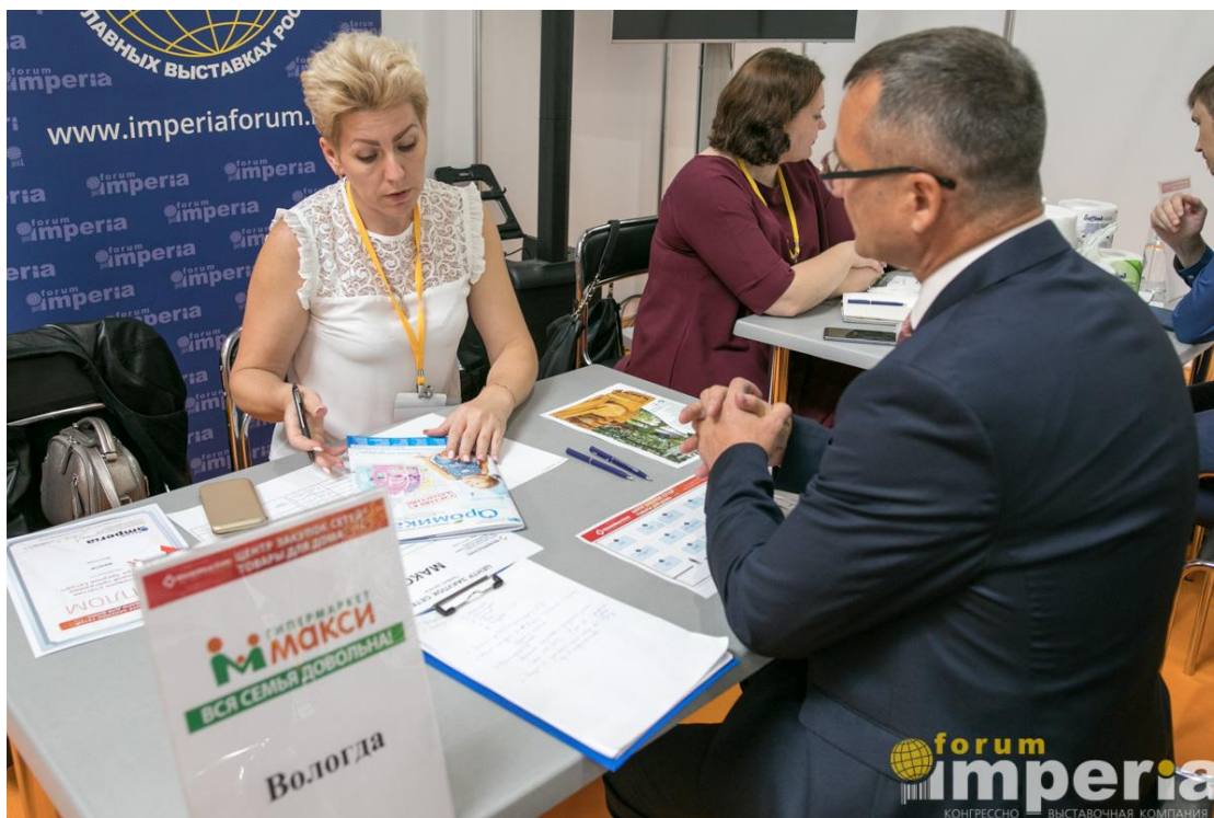
Переговоры с закупщиком розничной сети Макси