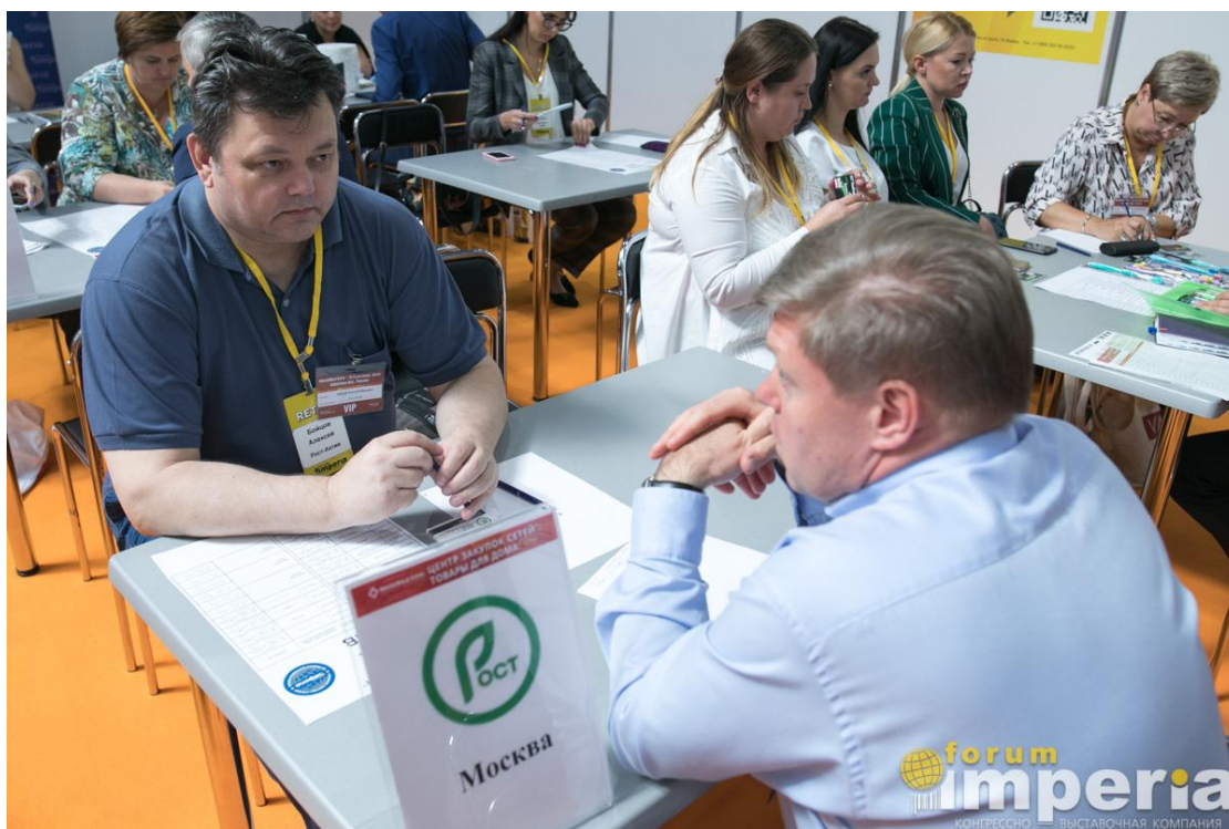
Переговоры с закупщиком кооператива Рост-Актив