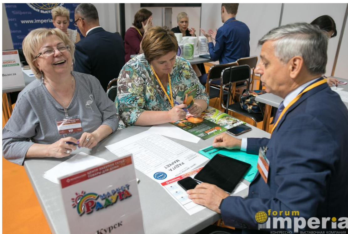
Переговоры с закупщиками розничной сети Радуга Маркет